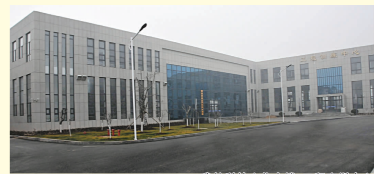
我校科技文化大楼、工程实训中心和智慧教室启用