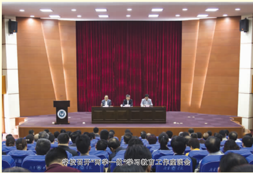
学校召开“两学一做”学习教育工作座谈会