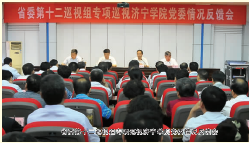
省委第十二巡视组专项巡视济宁学院党委情况反馈会

等措施,着力解决党员队伍在思想、组织、作风、纪律等方面的突出问题,强有力地推进了基层党组织建设。校党委理论学习中心组四个专题共召开19次会议(含扩大)集中学习研讨,扎实开展了学习贯彻十八届六中全会精神、全国高校思想政治工作会议精神系列活动。作为鲁西南地区最早共产党组织的诞生地,7月6日,隆重举行了“中共山东省立二师支部纪念馆”落成暨“中共山东省立二师支部成立90周年纪念展”揭幕仪式。12月12日,省委高校工委“两学一做”学习教育督导组来校督导检查,对我校“两学一做”学习教育及基层党建重点任务落实情况给予充分肯定。