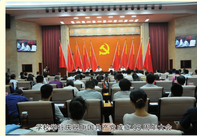
学校举行庆祝中国共产党成立95周年大会

根据省委统一部署,3月25日至5月25日,省委第十二巡视组对济宁学院党委开展了专项巡视。6月21日,省委第十二巡视组向济宁学院党委反馈专项巡视情况。7月7日,学校召开省委第十二巡视组专项巡视反馈意见整改工作推进会,制定了整改落实工作方案,将省委巡视组反馈的问题梳理细化为5个方面19项整改内容50条具体整改措施,并建立工作台账,逐一明确责任领导、责任单位、责任人员和完成时限,建立整改问题清单、任务清单、责任清单,逐个问题销号,确保条条整改、件件落实。学校以这次巡视为契机,把解决巡视反馈问题和学校转型发展、质量提升结合起来,把巡视成果转化为推动学校事业发展的强劲动力,开创了学校事业发展的新局面。